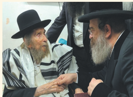
כ"ק האדמו"ר מסאדיגורה רבי ישראל משה פרידמן זצ"ל עם נשיא מועצת גדולי התורה הגאון הרב אהרן יהודה לייב שטיינמן זצ"ל. חסידות סאדיגורה היא ענף המסתעף מחסידות רוז'ין

ומאביהם. נרגש כולו יצא דרך השער החורק של חצר הביקתה אל השביל, הביט אל השמים המעוננים והתחיל לפסוע בדרך הכבושה בין שדות התבואה הקצורים. חיוך דל הסתמן על שפתיו. זאת הפעם, החליט, חייב הוא לבצע את מחשבתו, ויהי מה, אם לא עכשיו אימת?